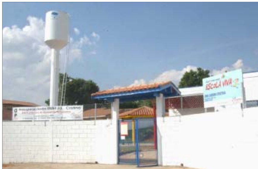
Creche do Jardim Cristina, Região Sudoeste, concluída com recursos do OP