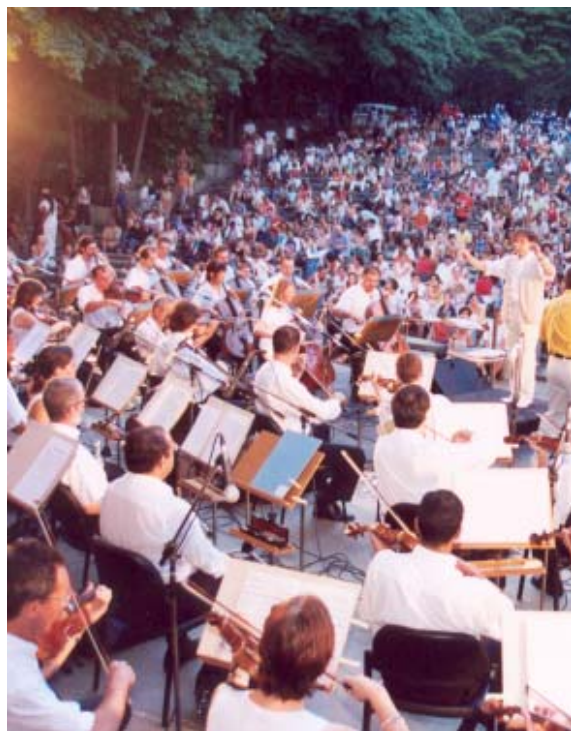
Orquestra Sinfônica: música e solidariedade

A primeira destas séries aconteceu nos dias 19, 20 e