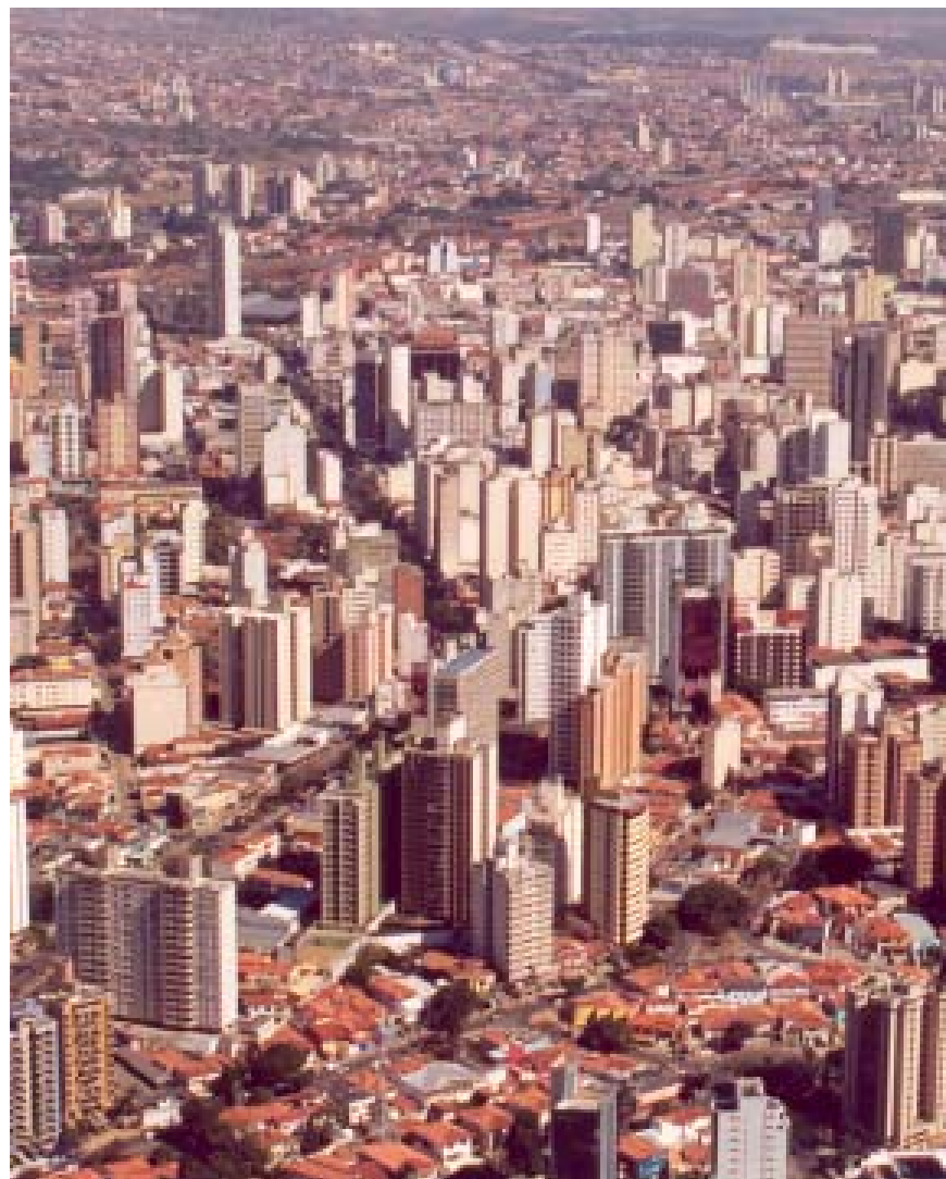
Campinas arrecadou R$ 887 milhões em 2002, superando previsão orçamentária

“Fechamos o ano com R$ 1,5 milhão em caixa, o que pro-