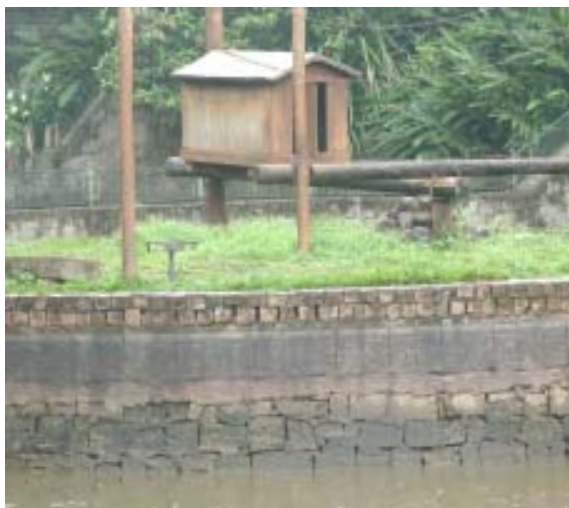
Abrigo dos macacos, próximo ao lago do Bosque

Os patos e as tartarugas que viviam no local foram transferidos para outros recintos da área, enquanto os peixes foram levados para o lago do Bosque do Distrito de Barão Geraldo. Em seguida, serão realizados os reparos nas paredes de concreto e pedra do lago, eliminando todas as trincas. Para isso, serão utilizados cerca de 20 m 3