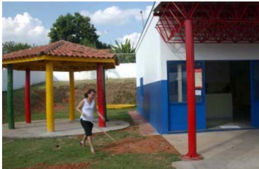
Pátio da nova creche do Jardim Cristina: 116 crianças de 4 a 6 anos atendidas

O valor total investido na conclusão obra foi de aproximadamente R$ 60 mil. Quando recebeu o prédio, a Prefeitura realizou uma primeira reforma destinando-o depois, a pedido da população, para abrigar a escola.