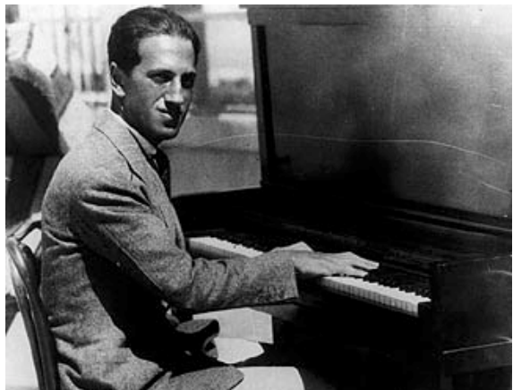
George Gershwin, no repertório da Sinfônica